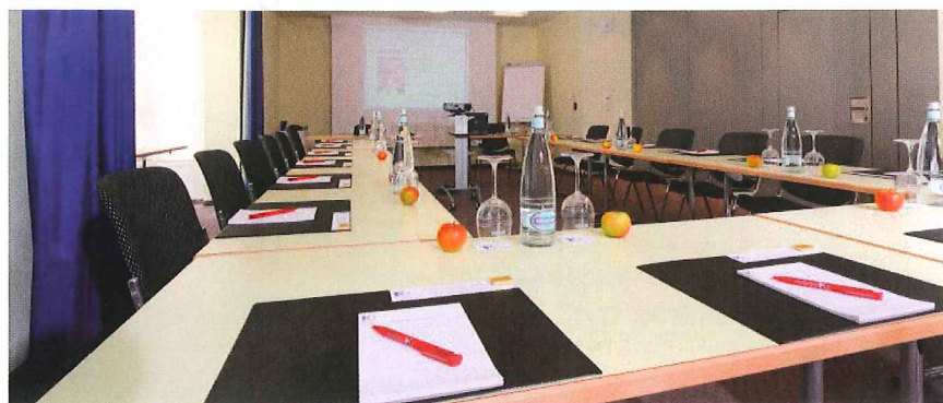
Blick in die renovierten Räumlichkeiten des Hotels Olten.

Mit der Namensänderung allein ist es nicht getan. Dies war sowohl dem Eigentümer als auch dem langjährigen Mieter bewusst als man 2011 beschloss, weitreichende Optimierungs-Massnahmen für das damalige «Congress Hotel Olten» umzusetzen.